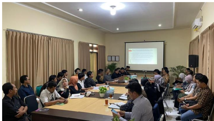
Gambar 1. 1. Rapat Koordinasi Mekanisme Penanganan Pelanggaran pada Jajaran Pengawas Ad hoc