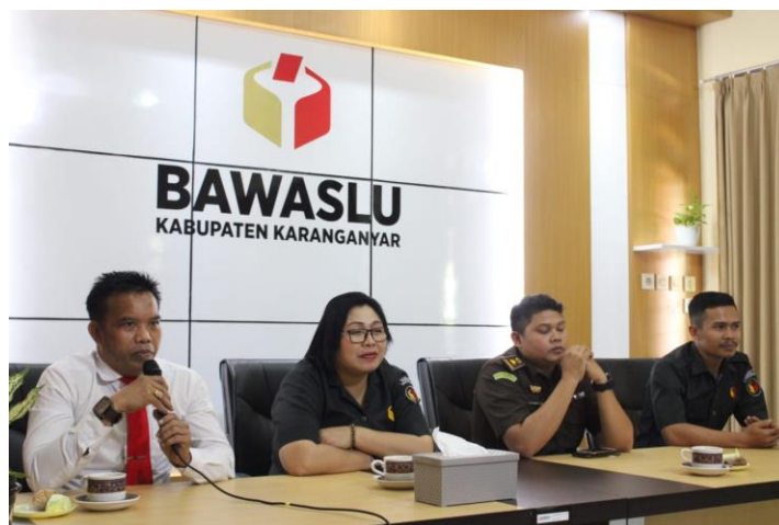
Gambar 1.2 Kanit Reskrim Polres Karanganyar menyampaikan pandangan saat Rapat Koordinasi Gakkumdu Kabupaten Karanganyar