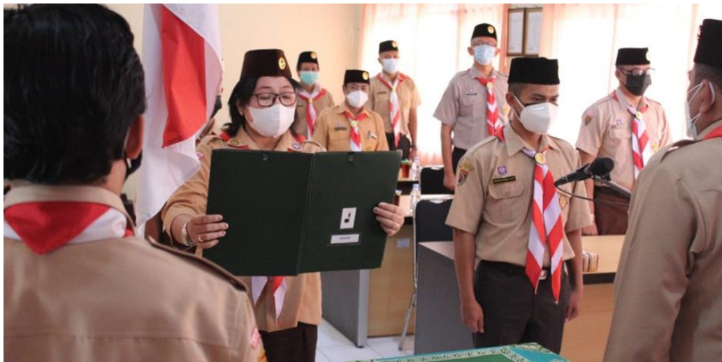
Gambar 1.5. pelantikan dan pengukuhan Saka Adhyasta Pemilu

Saka Adhyasta Pemilu melibatkan peserta dari beberapa SMA/K dan universitas yang berada di Kabupaten Karanganyar. Guna mengaktifkan dalam kegiatan yang berhubungan dengan kepramukaan maka Saka Adhyasta Pemilu Karanganyar mengikuti Anugerah Kehumasan Pandu Citraloka yang diadakan oleh Kwarda Jawa Tengah. Saka Adhyasta Pemilu Karanganyar mengikuti pada kategori Podcast yang mengambil tema “Menebar Manfaat Saka Adhyasta Pemilu” Podcast, Saka Adhyasta Pemilu mengikuti Presentasi Finalis bersama dengan 6 kontestan lainnya. Saka Adhyasta Pemilu Karanganyar masuk dalam final, Harapan yang ingin dicapai dari keikutsertaan ini adalah Saka Adhyasta Pemilu Karanganyar dapat lebih mengaktifkan Pengawasan Partisipatif terhadap masyarakat, khususnya pemilih pemula.