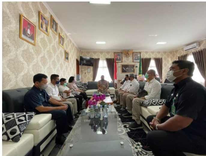
Gambar 1.7. Audiensi Bawaslu Karanganyar dengan Pengadilan Negeri Karanganyar