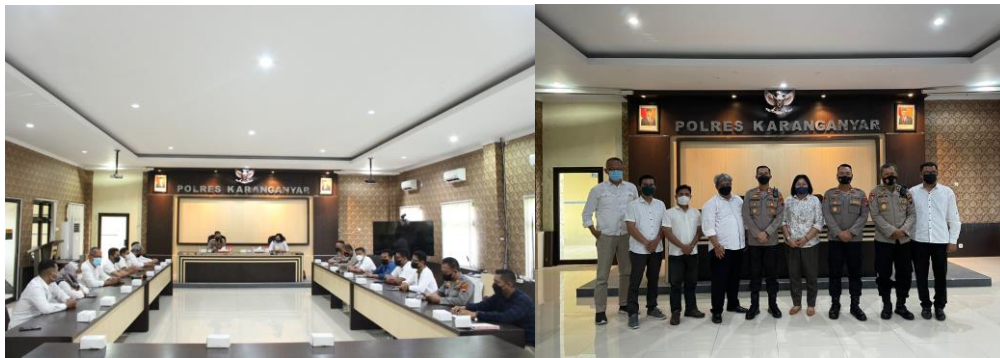
Gambar 1.9. Audiensi dengan Polres Karanganyar