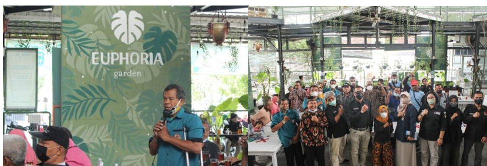
Gambar 1.4. Sosialisasi Pengawasan Partisipatif “ Pemilu Inklusif Bagi Penyandang Disabilitas “