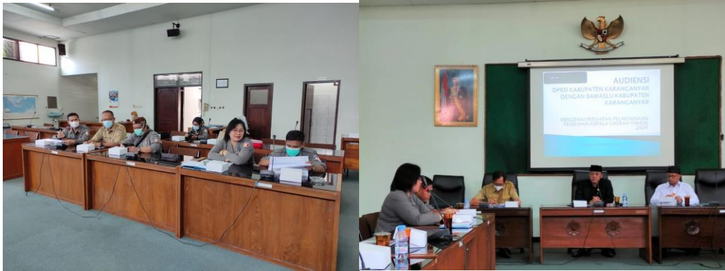
Gambar 1.8. Audiensi Bawaslu Kabupaten Karanganyar dengan DPRD Kabupaten Karanganyar