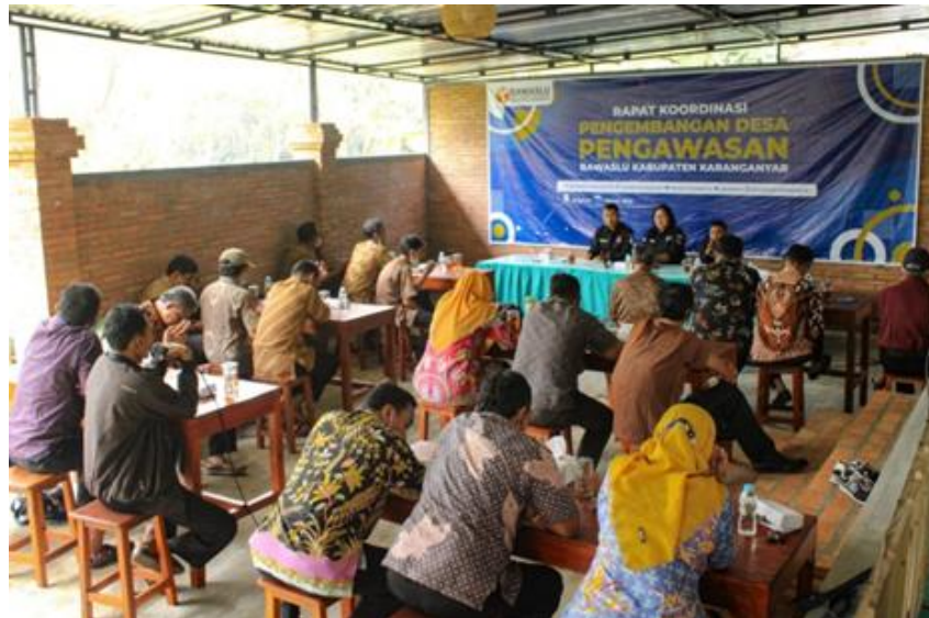
Gambar 1.3 Forum peserta Kegiatan Rakor Pengembangan Desa Pengawasan di desa Jatipuro – kec.Jatipuro