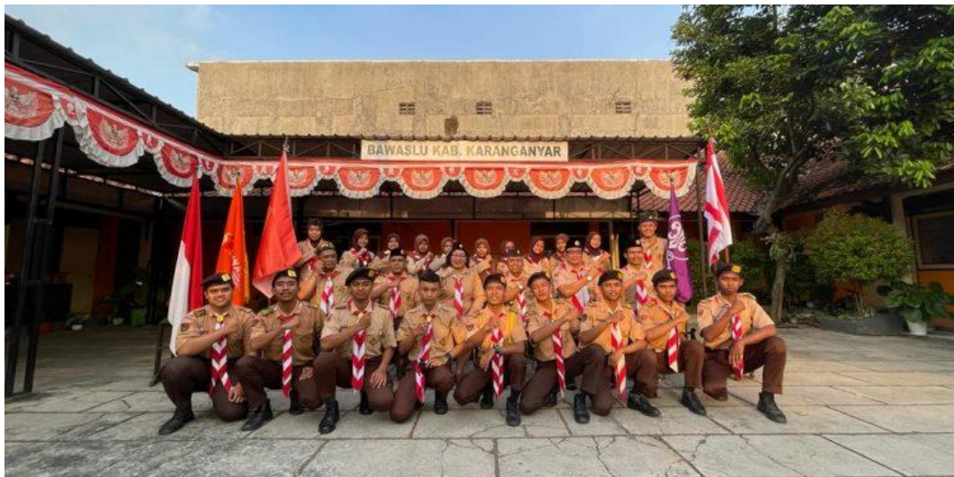
Gambar 1.6. Saka adhyasta Pemilu Bawaslu kabupaten Karanganyar